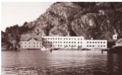
Den gjenoppbygde Eie Stentøifabrikk etter brannen i 1938.

Deretter var det stabil drift fram til 1938, da bedriften igjen ble rammet av brann. Etter denne brannen ble fabrikkens gjenreist i helt ny skikkelse og kunne i 1939 starte produksjon i en helt ny og moderne, funksjonalistisk fabrikkbygning. Nytt, moderne maskineri var også anskaffet, slik at bedriften sto godt rustet til den nye hverdagen etter andre verdenskrigs slutt.