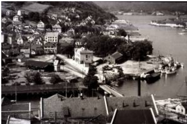
Stasjonsområdet i 1930-åra.

Da det ble klart at Sørlandsbanens gjennomføring ville bety at jernbanestasjonen måtte flyttes til Eie , så byens myndigheter store muligheter for å utvide sentrumsarealet betydelig, og i 1939 ble det satt i gang arbeid med Regulering av stasjonsområdet , en planleggingsprosess som skulle vare helt til 1967 før den kunne ansees som ferdig.