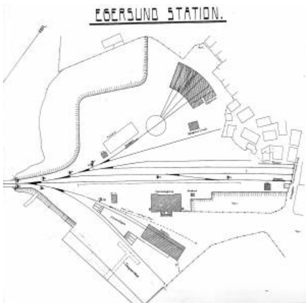
Plan over det nye stasjonsområdet i sentrum.

Hovedbygningen på gården, Nesgård , ble tatt i bruk som stasjonsbygning. Ikke fordi det var spesielt hensiktsmessig, men fordi det sparte statsbanene for å bygge en ny stasjonsbygning. Ellers ble stasjonen opparbeidet med pakk- og godshus, et pakkhus med plattform, svingskive, lokomotivstall med smie og vanntårn som fikk sin forsyning fra Egersund vannverk . På kaien ble det reist en svingkran.