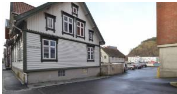
Sett fra Strandgaten.

Gata ble regulert i planen som ble laget etter bybrannen i 1843 , og ble da benevnt som Nedre Bækkegade. Navnet henspiller på at det før gikk en åpen bekk som kom fra området ved Prestegården. Bekken er forlengst lagt i rør under gata. 1)