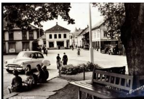
Under tuntreet i 1950-åra.

I 1944 ble Sørlandsbanen åpnet og stasjonen flyttet til Eie. Fortsatt var det trafikk til den gamle stasjonen i sentrum, men det var bare et tidsspørsmål om når dette ville opphøre.