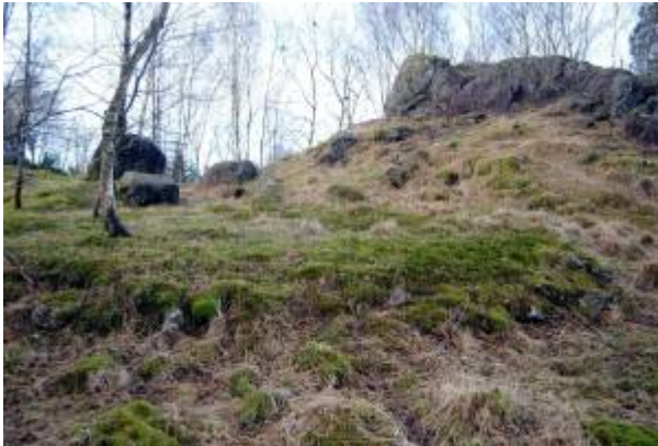
Bålplassen for rygla i Hobdalen, en rund flate med diameter 6 - 8 meter, er fortsatt godt synlig i terrenget.

Hver forsommer var det vanlig å bygge rygler, eller St. Hans bål, på toppene rundt byen: på Litla Varberg, Langaardsfjellet , Kråkefjellet , Årstadfjellet, Skrivarsfjellet og Hobdalen.