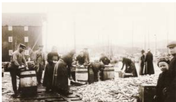
Sildesalting på Skriverallmenningen 1918.

I 1919 var første verdenskrig over og den frie handel skulle gjenopprettes. I det krigsherjede Europa var det stort behov for mat, og folk i sildenæringen håpet på at alt skulle bli slik det hadde vært før krigen, med godt fiske og god avsetning for både fersk og salt sild. Sildefisket fortsatte for fullt, og 1919 ble et nytt toppår, enda bedre enn 1916. Men indre uro og valutaproblemer både i Sovjetunionen og Polen, de beste markedene før krigen, gjorde det nesten umulig å få solgt saltsild der. Da den tyske marken kollapset var det heller ikke mulig å selge sild til Tyskland med rimelig fortjeneste. Resultatet var at det om sommeren 1921 lå lagret sild for mellom fem og seks millioner kroner i området mellom Flekkefjord og Egersund, mens sildespekulantene satt nedtyngt i gjeld. Økonomisk sett nærmet det seg kollaps.