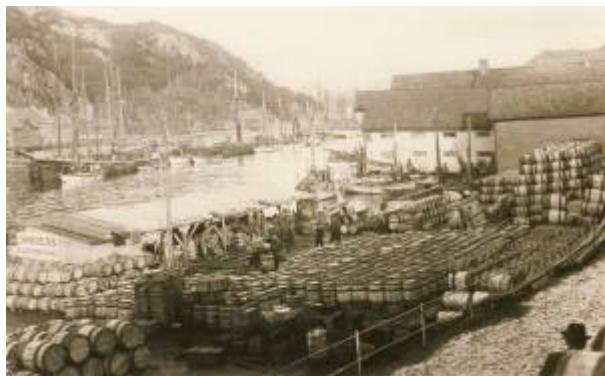
Chr. Michelsens sildelager på Bradbenken 1919.

I Nord-Norge og på Vestlandet hadde det vokst fram en betydelig sildjolje- og sildemelindustri allerede før første verdenskrig, mens det sør for Boknafjorden ikke fantes slike fabrikker. Årsaken til det var at ressursgrunnlaget ikke hadde vært godt nok. I 1918 sa britene opp kjøpeplikten, og for å trygge kystbefolkningens kår kjøpte nå staten opp all fisk som ikke kunne eksporteres. Og det var ikke lite: både i 1916 og 1917 var fangstene enorme. Britenes og statens oppkjøp resulterte i store overskuddslagere av sild, noe som bl.a. medførte at ressursgrunnlaget nå var til stede for å starte fabrikker i Egersund også. I 1918 ble således Egersund Sildoljefabrikk etablert mens Ryttervik Fabrikker startet opp året etter under navnet Egersunds Kraftfor og Sildoljefabrik A/S .