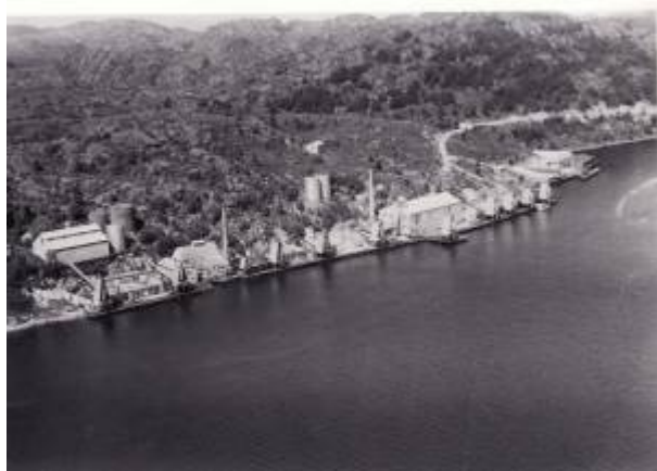
Egerø Sildoljefabrikk (lengst fra kamera) og Leidland Sildoljefabrikk ble satt i drift i hhv. 1938 og 1939.

Det gode ressurstilgangen ga grunnlag for utvidelse av fabrikkapasiteten, og i 1938 etablerte Isak O. Seglem Egerø Sildoljefabrikk ved Nysund. Året etter sto Leidland Sildoljefabrikk klar like ved. Stadig modernisering og utvikling av de to eldste fabrikkene og etablering av to nye fortonte seg som et industrieventyr for byens befolkning, dog ispedd en smule bitterhet over at alle virksomhetene lå i landsoknet mens byen måtte slite med lukta.